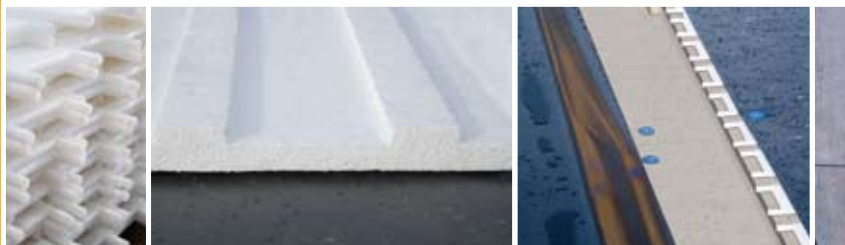
ORANJEDAK WERKT VOOR BOUWKUNDIG AANNEMERS

Moderne energiewinning uit daken komt tot stand door warmtewisselaars in de vorm van vloeistofhoudende leidingen of kunststof lamellen. Deze kunnen verwerkt worden in het dakoppervlak of in dakhekwerk. Met behulp van een warmtepomp en een opslagsysteem zorgen zij voor verwarming én koeling van gebouwen. Door gebruik te maken van energie-opslag in de bodem is het bijvoorbeeld mogelijk om uw gebouw in een koudere periode te verwarmen met de energie die in de zomer is opgeslagen. Zeker niet minder belangrijk is de mogelijkheid om met dit systeem het gebouw in warme perioden te koelen. Zo creëert u, in combinatie met andere DuBo systemen (duurzaam bouwen), ook gemakkelijk de gewenste nulbalans in de bodem. Daarmee geeft u een perfect antwoord op de steeds strenger wordende eisen aangaande Energie Prestatie Normering (EPN) en EPc (Energie Prestatie coëfficiënt).